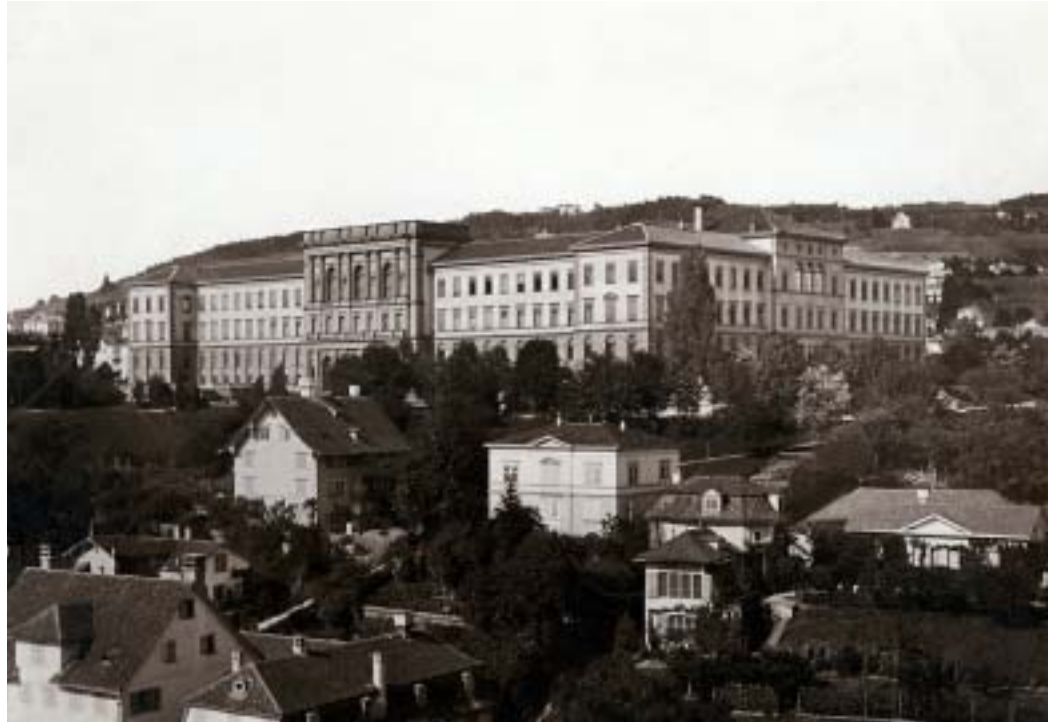
Symbolträchtige Architektur, bezeichnende Lage: Das von Gottfried Semper geschaffene «Eidgenössische Polytechnikum» in einer Aufnahme aus dem 19. Jahrhundert.