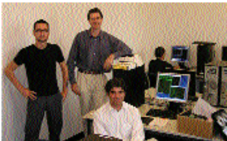
12.9.: «IT-Sicherheit ist für uns alle da»

Parallel zum Jahrhundertsommer: Präsentation der neusten ETH-Sportgeräte auf dem Zürichsee.