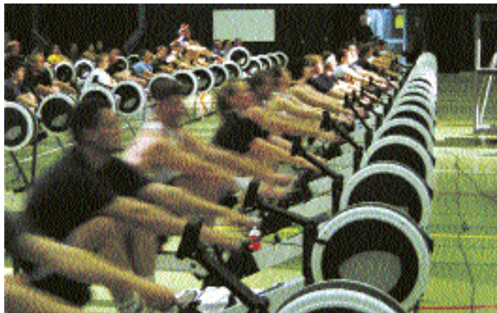
Höhepunkt am Rowing-Day ist ein Weltrekordversuch.