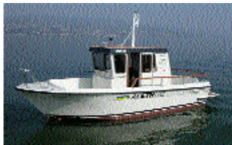
12.5.: Stürmische Taufe

David Basin übernahm die neue Professur für Informationssicherheit und die Leitung des ZISC.