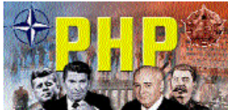
24.10.: Differenziertere Sicht

Das Archiv für Zeitgeschichte erschliesst eine einmalige Aktensammlung.