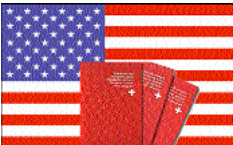
16.12.: Land des begrenzten Studierens?

Auf dem Höggerberg wurde Nobelpreisträger Kurt Wüthrich von der ETH noch einmal so richtig gefeiert.