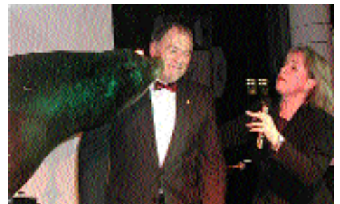
17.1.: Fest für einen und alle

Die Limnogeologen taufte ihr neues Forschungsboot, «Arethuse», Nachfolgerin von «Tethys».