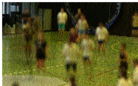
25.3.: Sportlern fehlt an Energie

Der 11. September 2001 wirkt sich auf die US-Hochschulen aus: Ein Blick aus der ETH über den Atlantik.