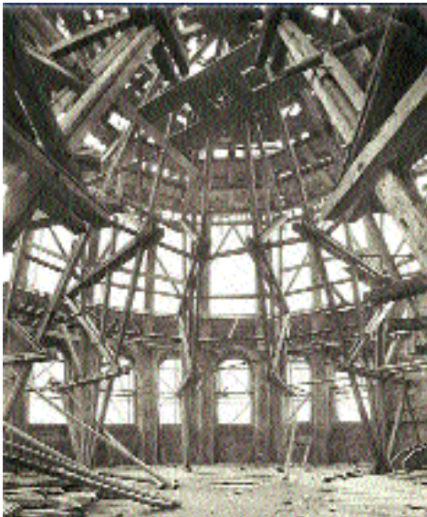
5.11.: Vom Wert der Wissenschaften

Divergierende Standpunkte, leidenschaftliche Plädoyers: Lebendiger Auftakt zu «Wissenschaft kontrovers».