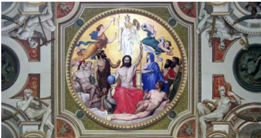
Opulente Hommage an die Wissenschaft: Die Darstellung der Geburt der Athene (der griechischen Göttin der Weisheit) aus dem Haupte des Zeus ist das Zentrum des Deckengemäldes in der Aula des ETH-Hauptgebäudes.

(1) Winfried Nerdinger, Werner Oechslin (Hgg.): Gottfried Semper (1803-1879). Architektur und Wissenschaft. Zürich und München 2003, gta Verlag/Prestel Verlag.