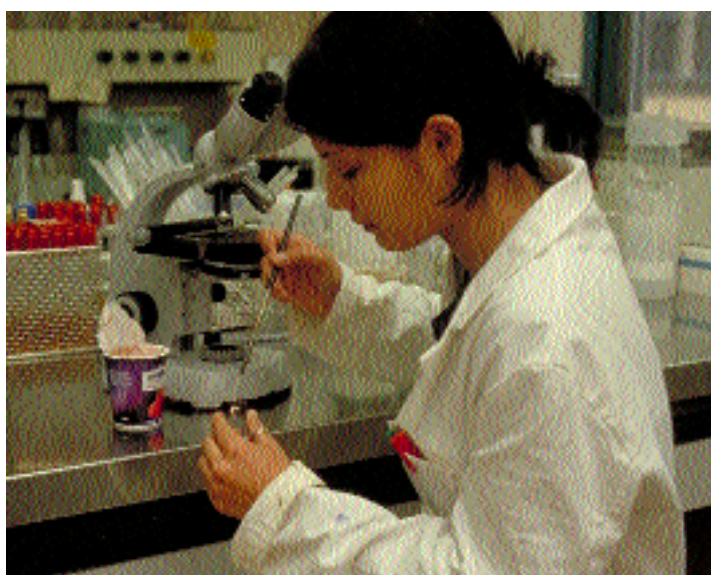
Doktorierende werden an der ETH Zürich nicht überall nach der neuen Regelung entlohnt.