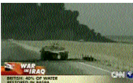
ab 20.3.: Krieg im Irak

Tagung des Swiss Forums for Sport Nutrition: Erstmals wird die Ernährung von Spitzensportlern analysiert.