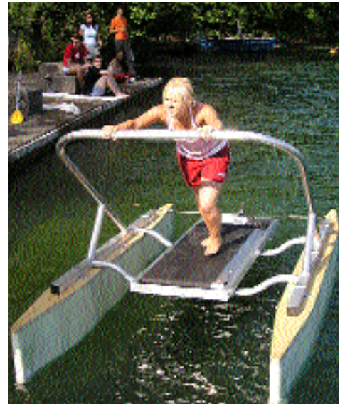
4.7.: Der See als Laufsteg

Das Parallel History Project on NATO and the Warsaw Pact (PHP) ermöglicht brisante Einsichten.