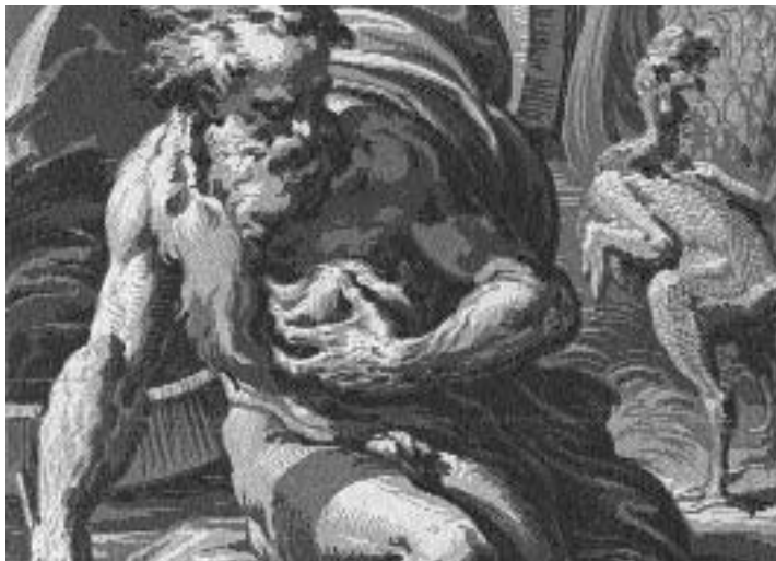
Ugo da Carpi, Diogenes nach Parmigianino (Detail), um 1527 Chiaroscuroschnitt, 45,3 x 33,1 cm.