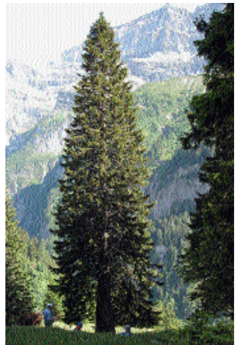
10.11.: Wunderbare Waldvermehrung

Auf dem Höggerberg soll eine Vision – «Science City» – Realität werden. ETH-Angehörige wirken mit.