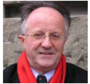
Intimer Semper-Kenner: Werner Oechslin, ETH-Professor für Kunst- und Architekturgeschichte.

Diese waren anfangs im Osttrakt untergebracht, der im Zuge des Umbaus unter Gustav Gull (1915 – 1924) völlig umgestaltet wurde. Vor dem heutigen ETH-Haupteingang stand ursprünglich, aus Sicherheitsgründen vom Hauptbau getrennt, das Chemie-