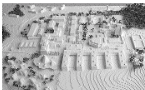
13.11.: «Science City» – eine Vision