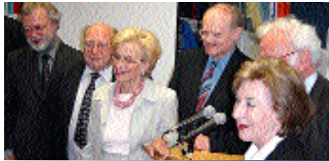
23.5.: Erinnerung an 20'000 Flüchtlinge

Divergierende Standpunkte, leidenschaftliche Plädoyers: Lebendiger Auftakt zu «Wissenschaft kontrovers».